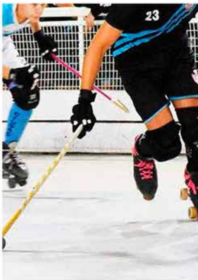
Club Harrods Gath y Chaves

camaradería entre los integrantes del equipo; será un modelo inobjetable de conducta y respeto por las reglas. Deberá consultar las cuestiones reglamentarias con el Capitán General o Coordinador deportivo. El Club Harrods Gath y Chaves, a través del DyR, fomenta la apertura de nuevas actividades y deportes, sobre la base de un proyecto integral que contemple: profesionales a cargo, planificación a mediano y largo plazo (4 y 8 años), proyección del ciclo deportivo, objetivos anuales medibles y comparables que permitan evaluar la factibilidad y su sustento.